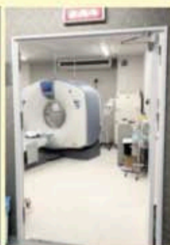
各種支援助成金まとめた市政報告 中央市民病院のコンテナ型CT室