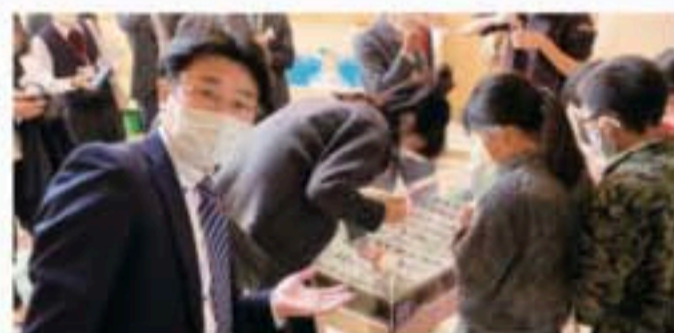
子どもたちのアマモの種植え