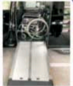
ユニバーサルデザイン タクシー