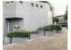
坂道での手すり設置