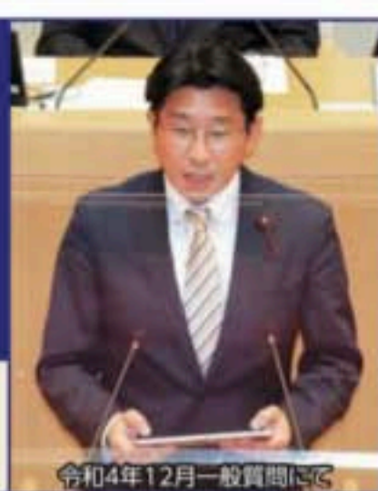
令和4年12月一般質問にて